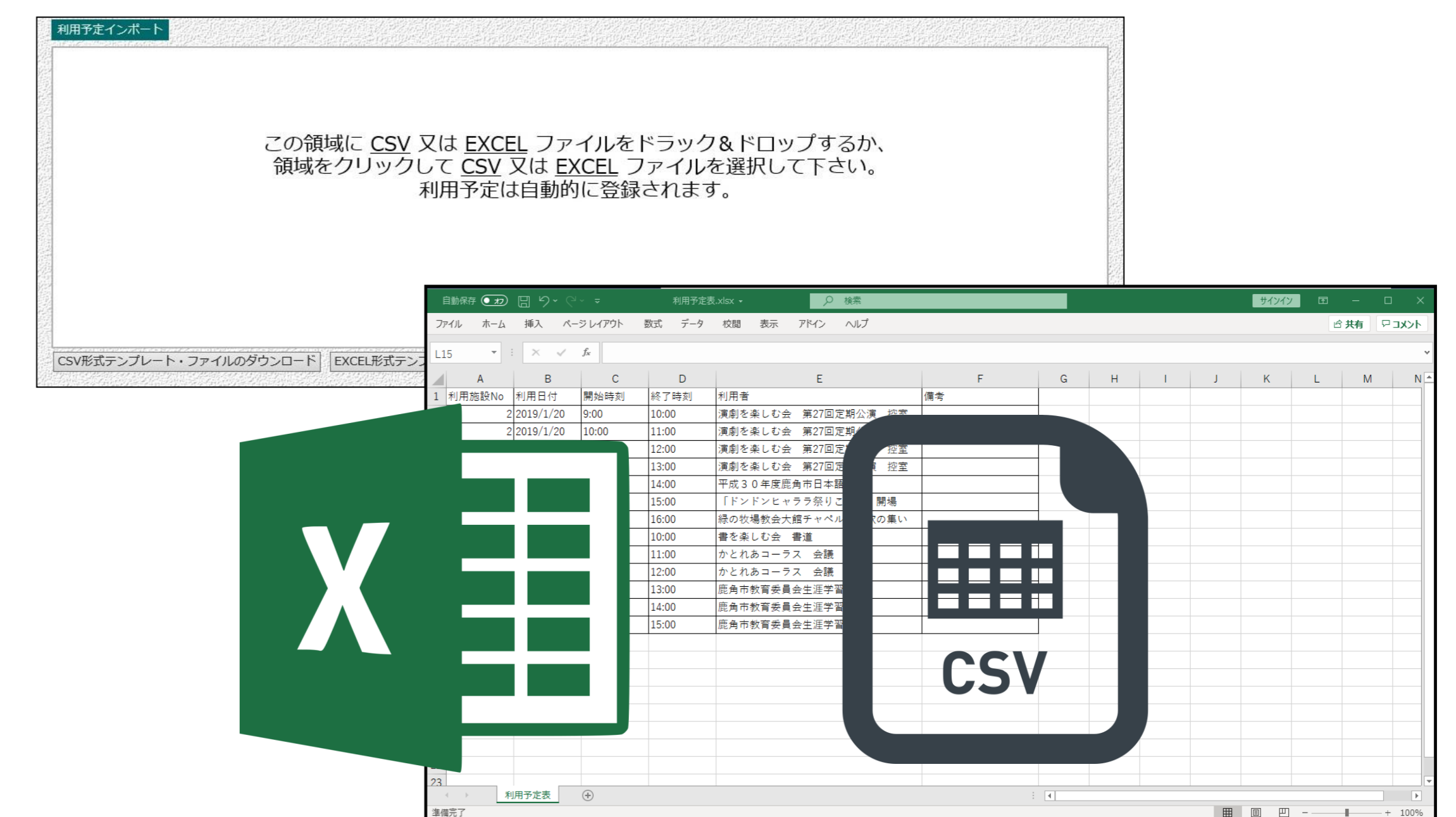
一括予約インポート画面